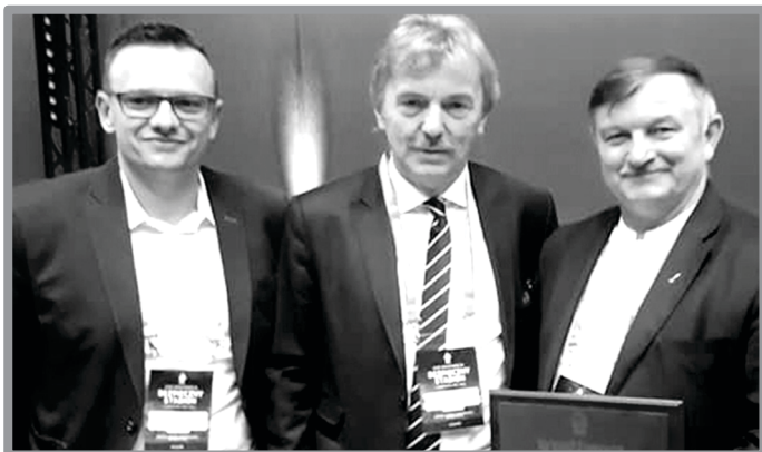
WYRÓŻNIENIE DLA GMINY ZBĄSZYNEK W KIELCACH