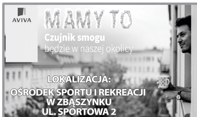
BĘDZIE CZUJNIK POMIARU JAKOŚCI POWIETRZA