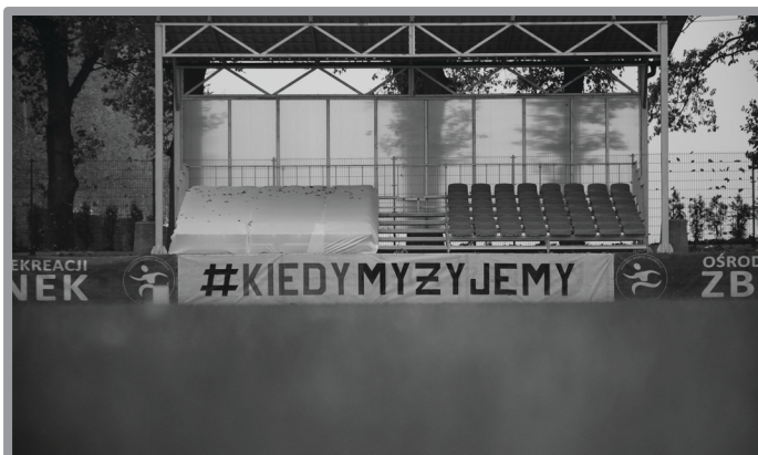
KIEDY MY ŻYJEMY - AKCENT PATRIOTYCZNY NA STADIONIE