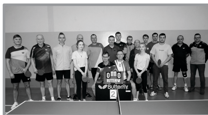
TENIS STOŁOWY - INAUGURACJA 12 EDYCJI