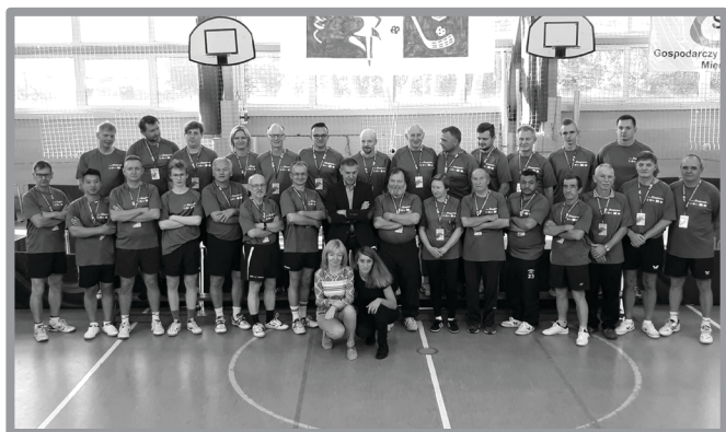
POLSKO-NIEMIECKI TURNIEJ TENISA STOŁOWEGO 6-7.10.2018

skierować do wszystkich osób i instytucji, którym ta dziedzina życia społecznego jest bliska. Dziękuję Państwu za cały 2018 rok i zapraszam do współpracy w 2019 roku. W imieniu całego Ośrodka Sportu i Rekreacji w Zbąszynku składam również Państwu najlepsze życzenia na ten okres świąteczno - noworoczny.