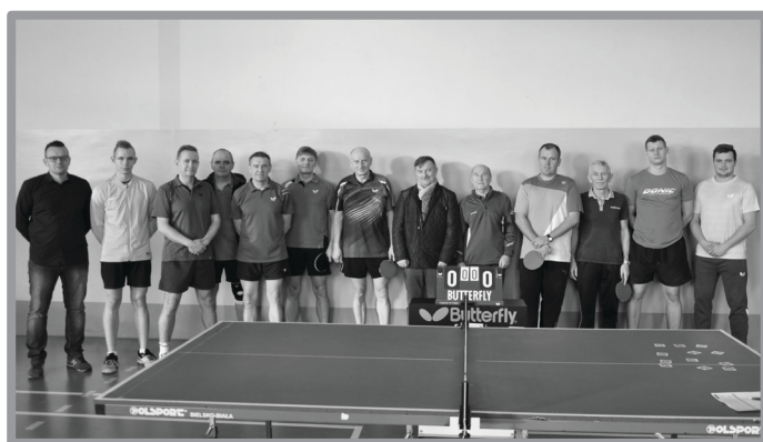
TURNIEJ TENISA STOŁOWEGO - II TURNIEJ