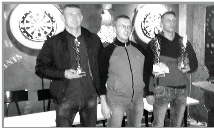
MIKOŁAJKOWY TURNIEJ W STEEL DARTA