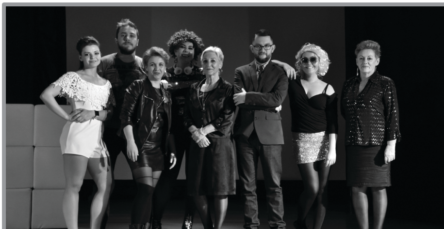
TEATR 18+ W SZTUCE "NIEDOTAŃCZONE ŻONY, CZYLI CZWARTE WESELE I POGRZEB"