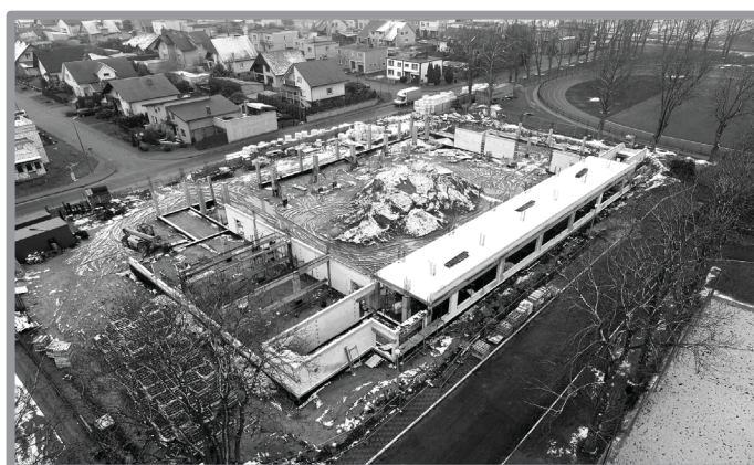
BUDOWA HALI SPORTOWEJ