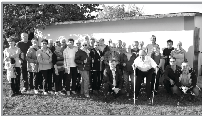
SPORTOWY SENIOR - KRĘGLE ORAZ NORDIC WALKING