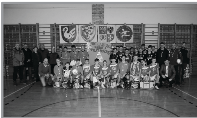
POWIATOWY MIKOŁAJKOWY TURNIEJ PIŁKARSKI