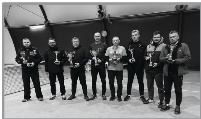
DEBŁOWY NIEPODLEGŁOŚCIOWY TURNIEJ TENISA ZIEMNEGO