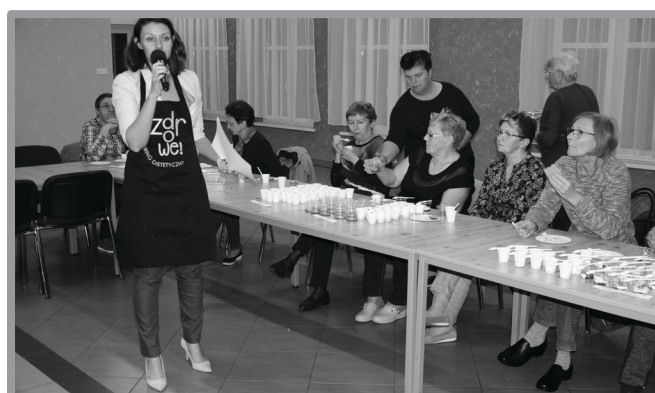
SPORTOWY SENIOR II - JAK ZDROWO ŻYĆ