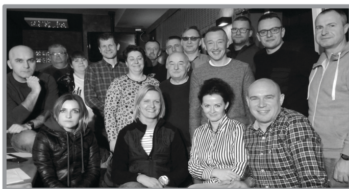
WALNE ZEBRANIE SPS ZBĄSZYNEK