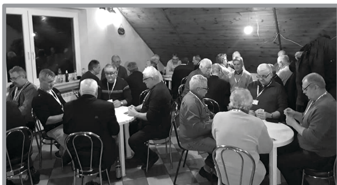
II TURNIEJ W RAMACH GRAND PRIX W KOPA