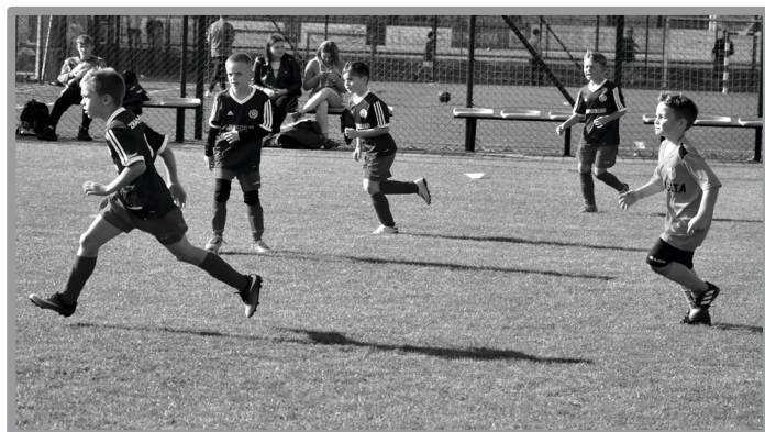
ELIMINACJE POWIATOWE TYMBARK