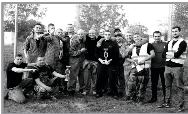
ZBĄSZYNEK PAINTBALL CUP