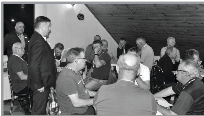
INAUGURACJA GRAND PRIX W KOPA