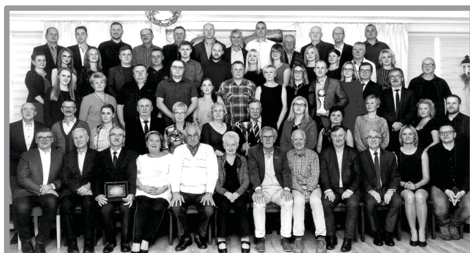
35 LECIE TKKF SEMAFOR ZBĄSZYNEK