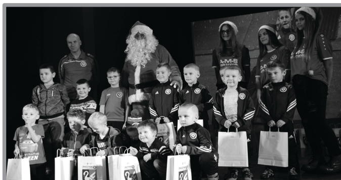
MIKOŁAJKOWA AKADEMIA PIŁKARSKA